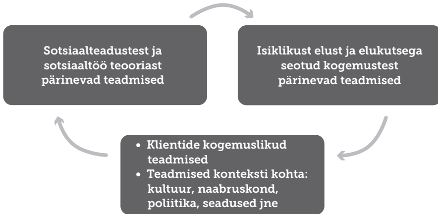
Joonis 2. Teadmiste allikad

Eelnevat aitab mõista joonis 3, mis näitab, et üldistatud tõendus põhised teadmised tuleb siduda professionaalsetel ja isiklikel kogemustel põhinevate teadmistega. Tulemuseks on sekkumine või lähenemisviis, mis on kujundatud kindla olukorra tarvis. Kui see viib soovitud tulemuseni, siis on see praktikapõhine tõend. See toimimisviis on tõendatud siiski ainult selle kindla olukorra puhul. Teadmiste laiemaks üldistamiseks on meil vaja koguda tõendeid sarnastest juhtumitest ja olukordadest. See on tsükli viimane lüli. Sotsiaaltö uurimus peab senisest enam keskenduma andmete kogumisele ja testimisele erinevate, kuid võrreldavate juhtumite kohta, et otsida ühiseid tegureid, mis tõhususele kaasa aitavad.