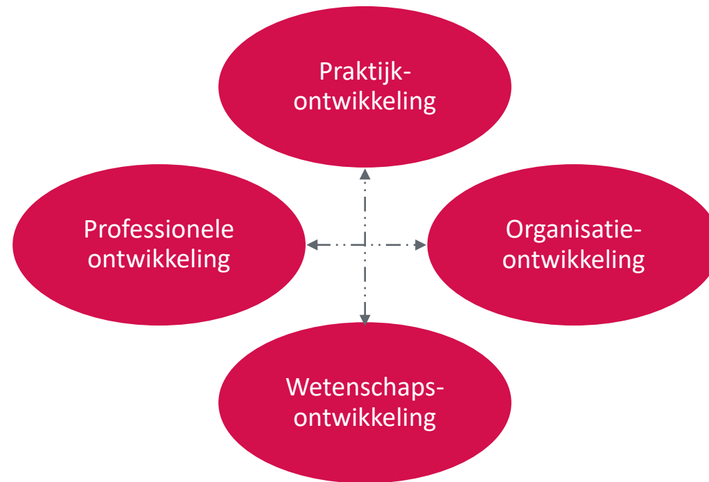
Afbeelding 1 - De vier doelen van actieonderzoek. Overgenomen uit Actieonderzoek: Principes voor verandering in zorg en welzijn (p. 10) door F. van Lieshout, G. Jacobs en S. Cardiff, 2017, Assen: Koninklijke Van Gorcum. Copyright 2017, F. van Lieshout, G. Jacobs en S. Cardiff.