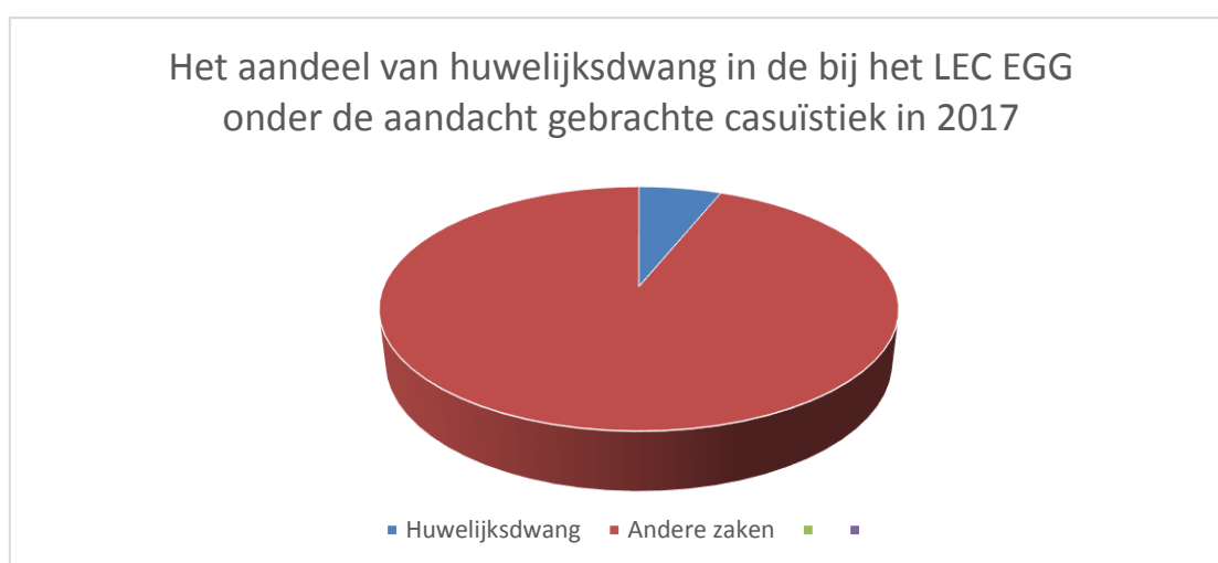
Figuur 5: Het aandeel van huwelijksdwang in het werkaanbod van het LEC EGG

In het peiljaar 2017 werden in totaal door de regionale eenheden 1496 zaken behandeld, waarbij rekening werd gehouden met een eermotief. Bijna een derde van die zaken (n=456) werden complex gevonden. Om die reden werden zij ook voorgelegd aan het LEC EGG. Bij elf procent van de zaken die in 2017 aan het LEC EGG werden voorgelegd speelde dwang een rol (n= 49) (LEC EGG, 2018). Ruim de helft van die zaken (n=28) werd in verband gebracht met het fenomeen huwelijksdwang. Bij die andere zaken speelden dwang een rol bij andere gedragingen, zoals achterlating (n=18). Het aandeel van huwelijksdwang in het totale werkaanbod van het LEC EGG is met zes procent, zoals figuur 5 laat zien, relatief klein.