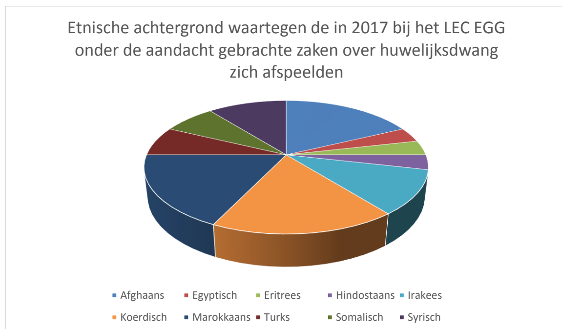
Figuur 6: Etnische achtergrond bij huwelijksdwang in het werkaanbod van het LEC EGG