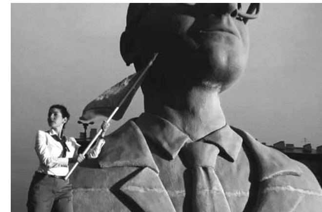
Yael Bartana (Kfar Yehezkel, Israël, 1970) ... and Europe will be stunned 2011

Schizofrenie steekt de kop op: de markt wordt kritisch geanalyseerd in lezingen en symposia op grote kunstbeurzen. Manifesta-organisaties (buiten de markt opererende instellingen) flirten openlijk met galleries en collectioneers. Galleries die op hun beurt hun stands op beurzen inrichten als kleine museale tentoonstellinkjes. Dit om met name de handelswaarde te doen toenemen in een systeem (maatschappij) dat de jacht op winst boven alles lijkt te stellen.