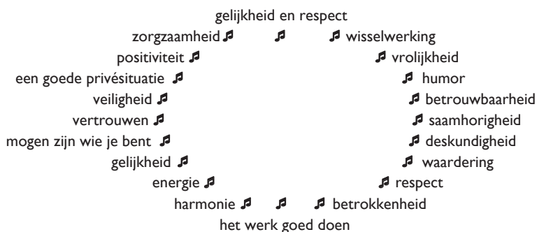
Figuur 2: De klankkast van de workshop: de kern van wat zorgmedewerkers nodig hebben om in het werk het beste uit zichzelf te halen, willekeurig gerangschikt

zijn gekomen: (...) die allemaal het gewone moeten beschermen in plaats van het vreemde, en daarbij het mogelijke onmogelijk maken, dat zij allen filosofisch worden, in deze betekenis, namelijk het mogelijke behartigen, het veelvuldige bevorderen' (Janssens & Steyaert, 2001: 105).