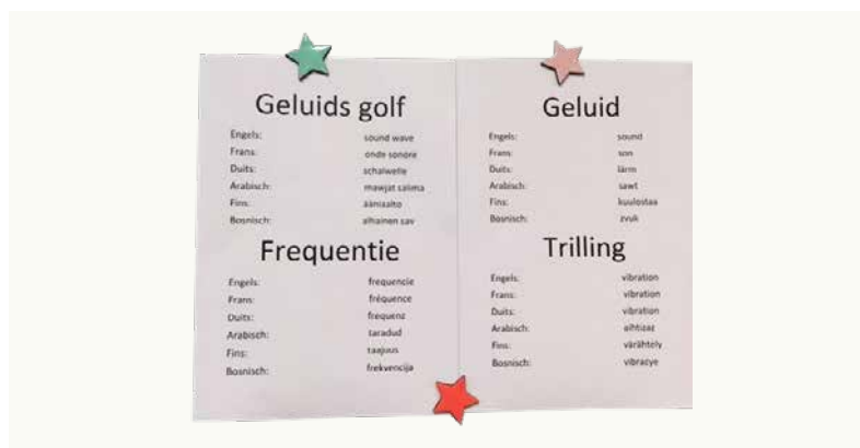
Voorbeeld van meertaligheid in het klaslokaal

In het internationale onderzoeksprogramma Inclusive Education van Nordforsk en NRO 1 ontwikkelden en beproefden Nederlandse, Zweedse en Noorse onderzoekers lesmateriaal voor Natuur en Techniek (N&T). Daarin stonden op inclusie gerichte didactische strategieën centraal: het bevorderen van betekenisvolle interactie (Driver et al., 1994; Osborne, 2007), scaffolding van taal (adaptieve talige ondersteuning; Gibbons, 2002; Smit, Van Eerde, & Bakker, 2013), en het benutten van meertaligheid als bron bij het leren (Garcia & Wei, 2014). In de drie landen werd onderzocht hoe een taalgerichte aanpak bijdraagt aan inclusief onderwijs in meertalige basisschoolgroepen. Hieronder leggen we onze benadering van inclusief N&T-onderwijs nader uit en presenteren we observaties en reflecties van Nederlandse leerkrachten.