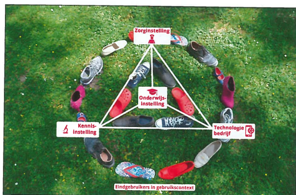
Afbeelding 2. Het cross-disciplinaire innovatieteam: belanghebbenden in een proeftuin, omringd door de eindgebruikers.

De onderzoekslijn 'Zorginnovatie met Technologie' richt zich de komende jaren op het cross-disciplinair onderzoeken, ontwerpen en implementeren van zorginnovaties voor zorg en gezondheid. Hierbij moeten zorginnovaties de praktijk ondersteunen en moet de (toegevoegde) waarde van zorginnovaties zichtbaar worden. Aspecten als acceptatie van technische zorginnovaties, realisatie van acceptatie en adoptie van zorginnovaties komen in alle activiteiten